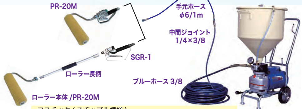
ローラー本体 / PR-20M

マスチック (スチップル模様) 圧送ローラーでネタを配り、空ローラーでパターン付の作業も! ※又は、圧送ローラーの空ローラーで仕上げ。