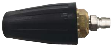
高圧カプラ付強力ターボノズル

高圧カプラ 2TPM を 1 個、カプラ仕様と指定してご注文してください。 商品コード 222096